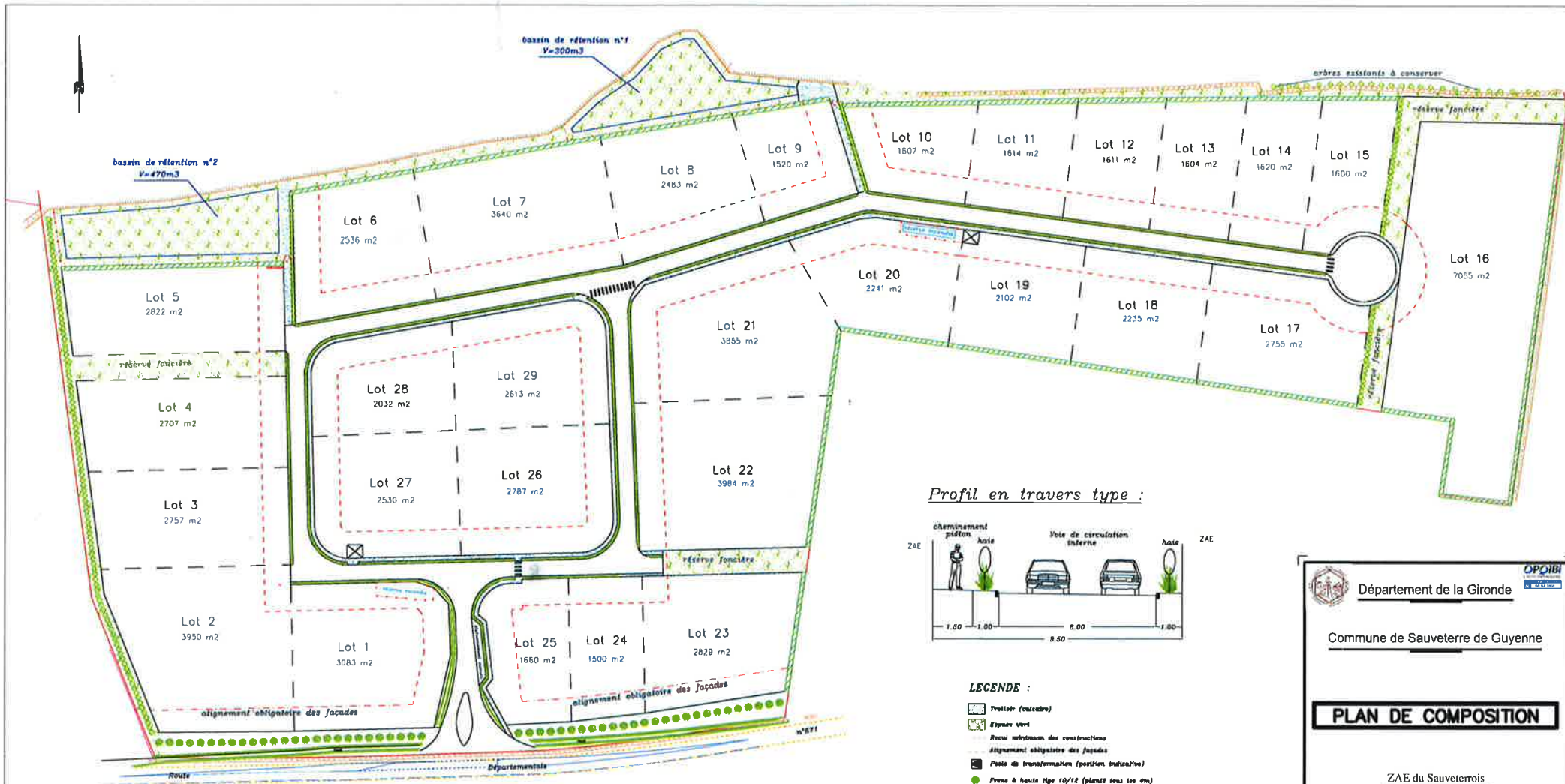
Profil en travers type :